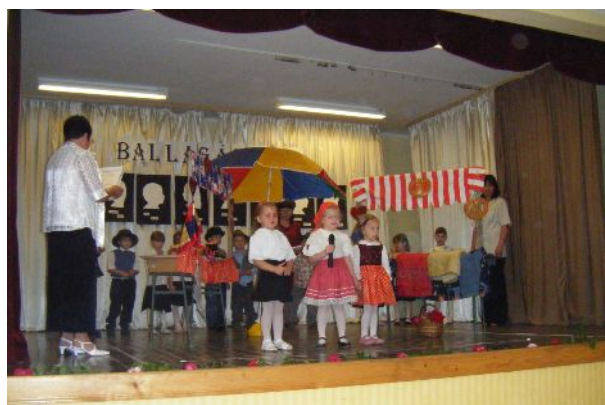
Május 30.: Helyi óvodások tanévzáró ünnepsége, Ballagó óvodások búcsúztatása