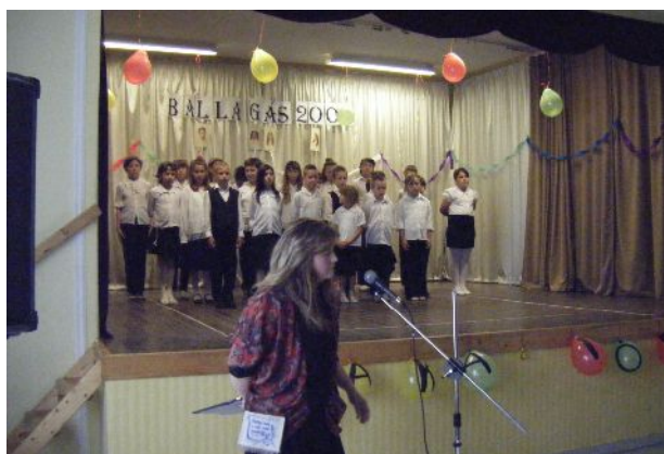
Június 12.: Helyi általános iskolások tanévzáró ünnepsége, 4. osztályosok búcsúztatása