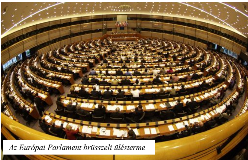
Az Európai Parlament brüsszeli ülésterme

Az Európai Unió országában 2009. június 4. és 7. között - Magyarországon a köztársasági elnök döntésének megfelelően, június 7-én vasárnap 06,00-19,00 óráig - választják meg az Európai Parlament új tagjait a következő öt évre.